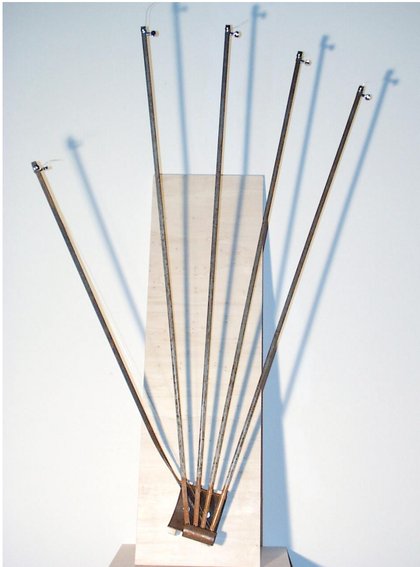
Linke Alienhand (Klangobjekt aus Stahl mit Cellosaiten)