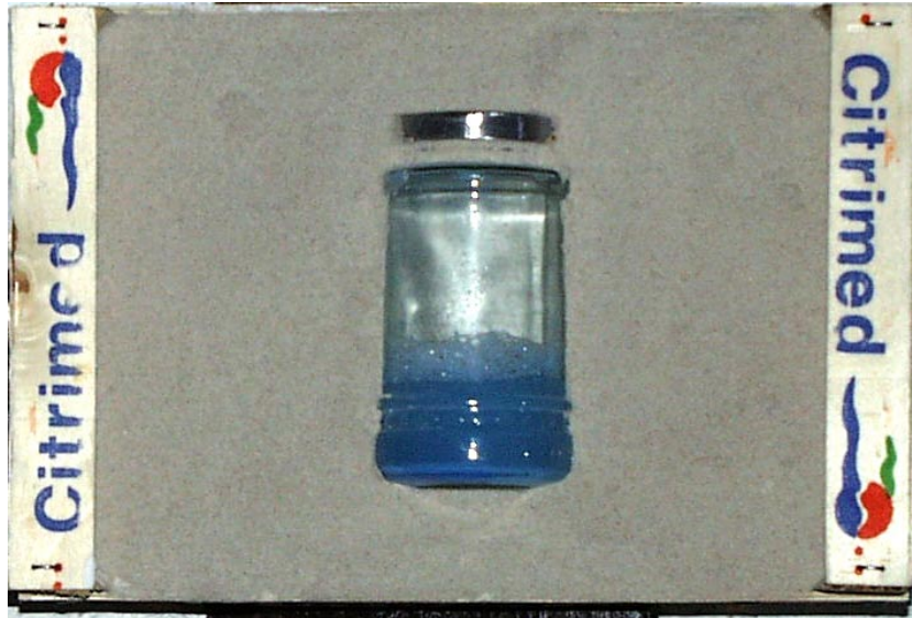
Citrimed Blutkonserve (Blaues Blut beginnt zu kochen, wenn sich ein Betrachter nähert)